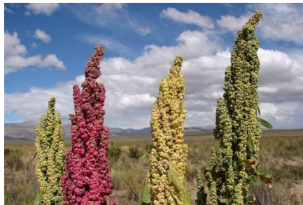
Planta de amaranto

Es importante conservar, cultivar y alimentarse de productos propios, naturales, sin manipulación genética ni transgénicos, porque esta manipulación de los alimentos lleva consigo enfermedades.