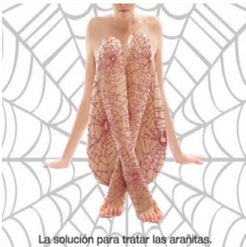
La solución para tratar las arañitas.

¿Cuántos productos se ofrecen para mantenernos jóvenes, que desaparezcan las arrugas, para estar "bellas"?