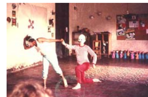
Biblioteca de la casa de Guanuca. 1988

Todos estos factores permearon en el grupo, intentando buscar mecanismos de fortalecimiento, participación, controles internos y democratización, pero fue en vano, solucionado el conflicto con una ruptura y división del grupo, el grupo mayoritario dio inicio al Colectivo de Mujeres de Matagalpa.