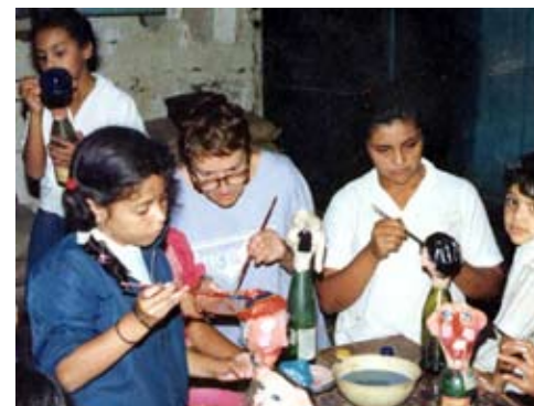
Taller de títeres con niñez, Guanuca, 1988

Difundiendo nuestro trabajo y buscando alianzas, entre ellas organizando y realizando una gira a Europa en 1999, (España, Italia, Alemania, Suiza, Inglaterra). Algunas actividades estaban garantizadas por un proyecto financiado por una sola agencia, (AOS, Ayuda Obrera Suiza).