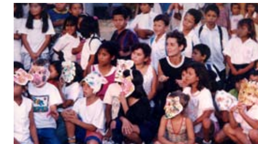
Presentación de teatro del "Rincón de los sueños"

Se introduce la estrategia de atención , atención en salud, atención jurídica legal y ampliación del servicio de la biblioteca.