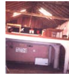
Foto.- Local de Guanuca. Biblioteca 1988

Comenzamos un grupo de mujeres en la segunda mitad de la década de los 80, en Matagalpa entre el grupo viernes y el grupos de teatro, en el barrio Guanuca 7 , con ganas, entusiasmo, necesidad de que los derechos de las mujeres fueran visibilizados e incorporados en las políticas públicas. 8 , iniciamos con el nombre de Cihuatlampa.