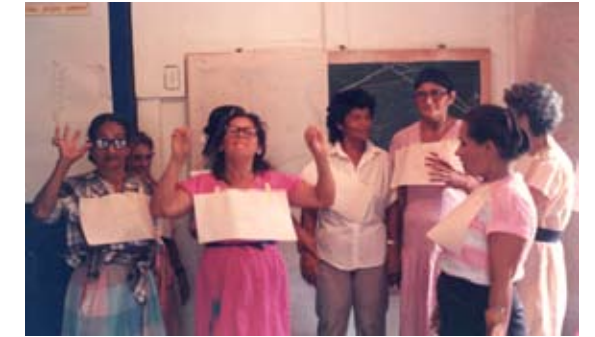
Capacitación a parteras.

los procesos de reflexión y capacitación interna, incluyendo las evaluaciones y acompañamientos externos para nuestro fortalecimiento y crecimiento, ampliación de presencia en los medios de comunicación media hora de transmisión diaria, ampliación de creación de obras de teatro con temas coyunturales y temas específicos de los derechos de las mujeres 14 , fortaleciendo el centro de documentación, ampliando la biblioteca infantil y textos no sexistas, asumiendo la capacitación a parteras, ampliando la capacitación a promotoras con botiquín comunitarios, mujeres de las comunidades, trabajadoras sexuales, jóvenes, ampliación del trabajo con la niñez y la capacitación con metodologías innovadoras al personal de salud, diagnósticos participativos.