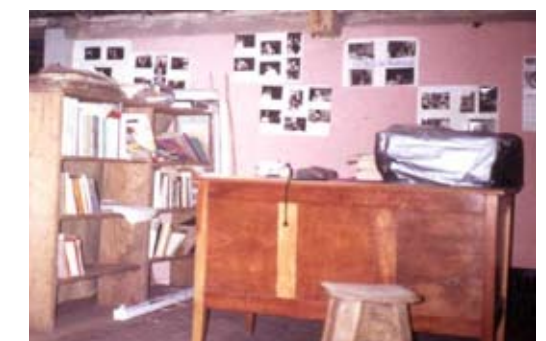
Ensayo de teatro en la casa Guanuca. 1989