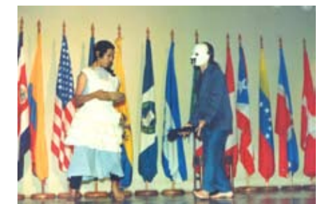
Presentación de Ahora que hacer. Encuentro de Juristas Managua

Iniciamos este proyecto en un momento político de desencanto del rumbo y conducción política, no solamente a nivel de las reivindicaciones de las mujeres, sino por los estilos de liderazgo, los abusos de autoridad, y la falta de credibilidad de las personas hacia los cargos de poder, que culminó con la pérdida de las elecciones del Frente Sandinista y con ello